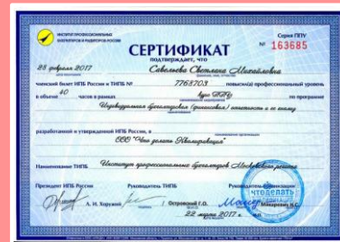
Сертификат ИПБ России на 40 ч. (для бухгалтеров)