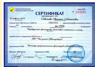
Сертификат ИПБ России на 40 ч. (для профбухгалтеров)