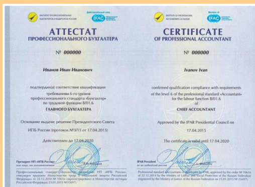
Аттестат профессионального бухгалтера с членством в ИПБ России (выдаётся в случае успешной сдачи экзамена)