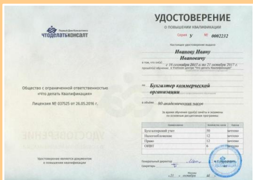
Удостоверение о повышении квалификации